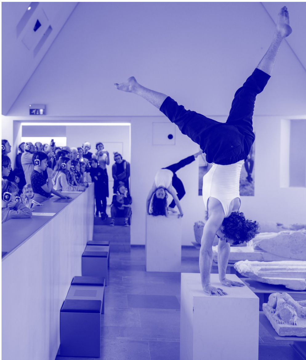
Axis Mundi © Thomas Brousmiche