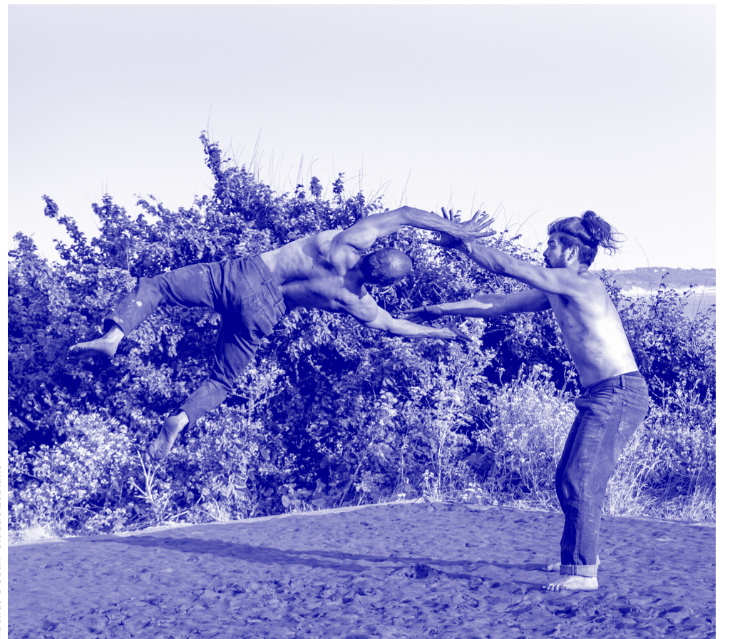
Huellas © Jean-Claude Leblanc