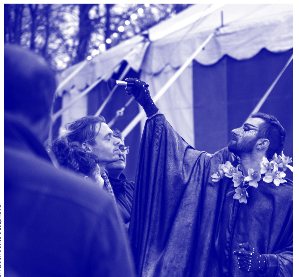
Le Premier Artifice

Conseillé à partir de 8 ans | Durée : 1h10 Tarifs : 5 € à 12 €, sur réservation