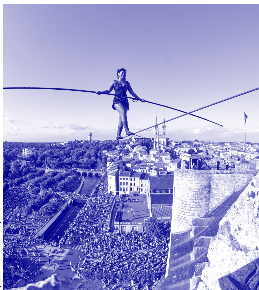
Lignes ouvertes

Le festival Le Mans fait son Cirque est organisé par Le Plongeoir, Pôle national Cirque Le Mans Sarthe Pays de la Loire, en partenariat avec la Ville du Mans. Le Plongeoir est soutenu pour l'ensemble de ses missions par la Ville du Mans, le Conseil départemental de la Sarthe, le Conseil régional des Pays de la Loire et l'État – Direction régionale des Affaires culturelles des Pays de la Loire.