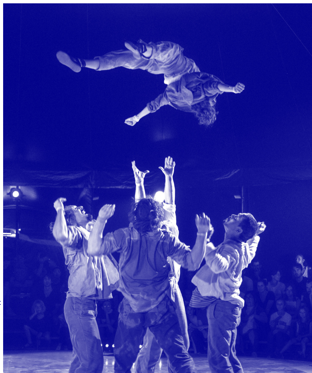
Radio Maniok © Romain Philippon

Tout public | Spectacle naturellement accessible Durée: 40 min | Gratuit, sans réservation